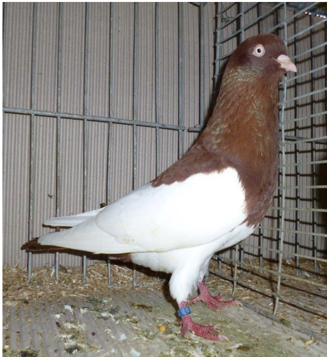
Sg Schnabelfarbe und feste Feder, mehr Brusttiefe