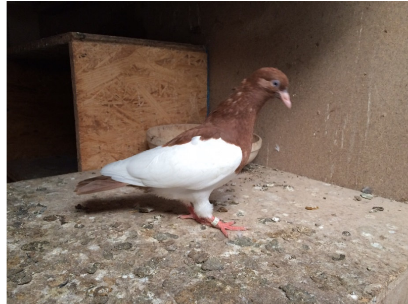
Feine Elsterzeichnung beim roten Jungtier