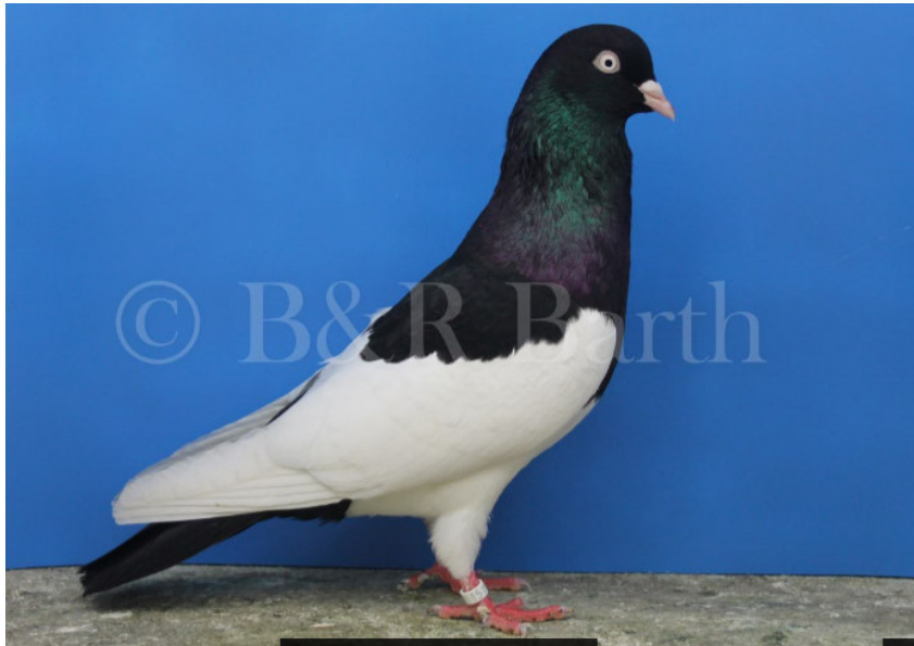
sg abfallende Haltung, Flügelbug könnte besser eingebaut sein und Augenrand abgedeckter