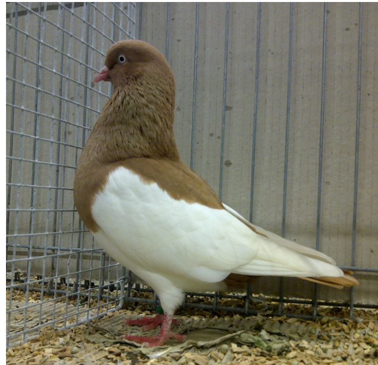
Sg Brusttiefe, Randabdeckung und abfallende Haltung, Halsfeder straffer