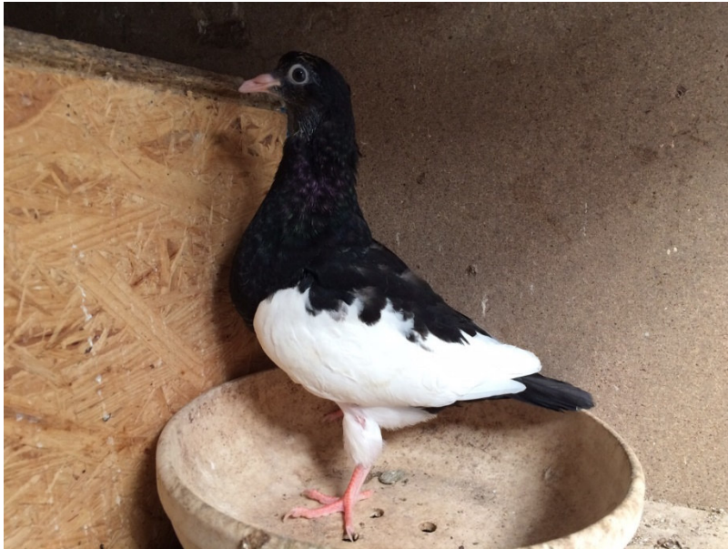
Unschärfe Herzzeichnung aufgrund Einkreuzung von Weißschlägen